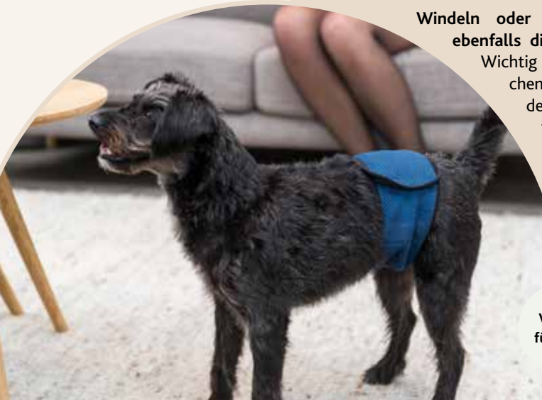
Windeln für Rüden

Wenn es doch zu Urin- und Kotflecken kommt, helfen spezielle Putz- und Waschmittel, Schmutz und Geruch wieder vollständig zu beseitigen. Auch Erbrochenes und andere intensive Tiergerüche lassen sich damit zuverlässig entfernen. Gerade Liegeplätze, die öfter gewaschen werden, sollten mit einem tiergerechten und geruchsneutralen Waschmittel gereinigt werden. Optimal sind auch Liegeplätze, die sich bei hohen Temperaturen waschen lassen.