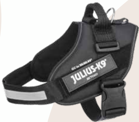
Julius-K9® IDC® Powergeschirr

Viele alte Vierbeiner lieben ihre Rituale, aber für demenzkranke Tiere sind sie noch wichtiger. Besonders Schnüffelteppiche können eine große Hilfe sein. Das Schnüffeln wirkt beruhigend und auslastend und trägt dazu bei, Phasen der Unruhe zu unterbrechen. Morgens und abends aus dem Schnüffelteppich zu füttern, unterstützt die Grauschнауzen dabei, in den Tag zu starten bzw. abends den Tag zu beenden. Außerdem helfen kleine Aufgaben dem dementen Senior, im Geist so aktiv wie möglich zu bleiben. Am besten legt ihr mehrfach täglich kurze, spielerische Einheiten ein. Kleine Apportierspiele eignen sich dafür hervorragend.