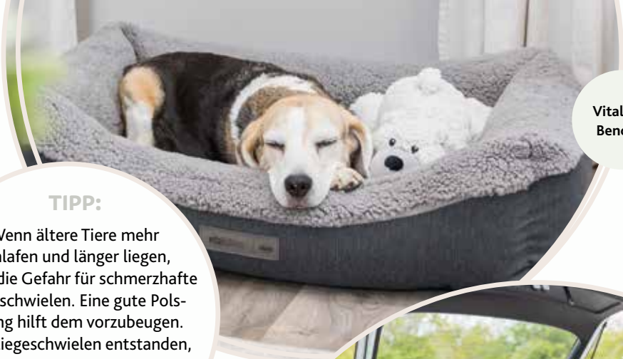
Vital Bett Bendson