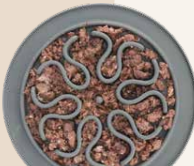
Slow Feeding Futtermatte