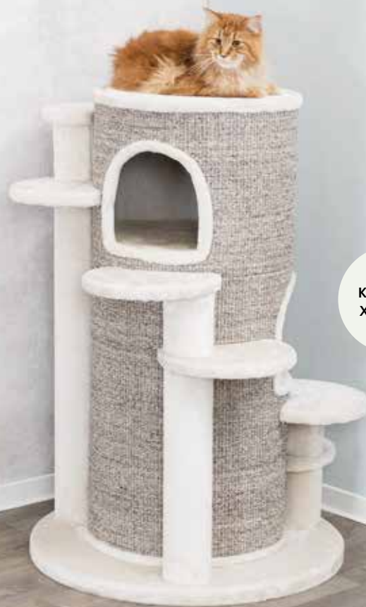
Kratzbaum XXL Oskar