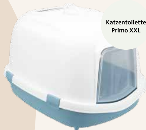
Katzentoilette Primo XXL