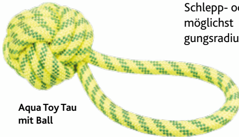
Aqua Toy Tau mit Ball