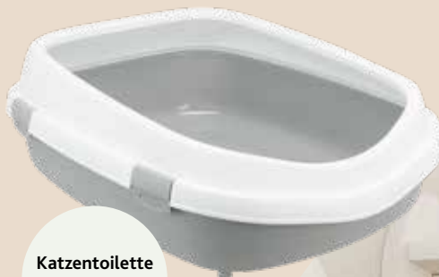
Katzentoilette Primo XXL Top

Wenn der Rücken nicht mehr so gelenkig ist und das Umdrehen schwerer fällt, darf die Katzentoilette gern ein bisschen größer sein. Ein niedriger Einstieg oder eine Rampe helfen beim Hinein- und Herauskommen.