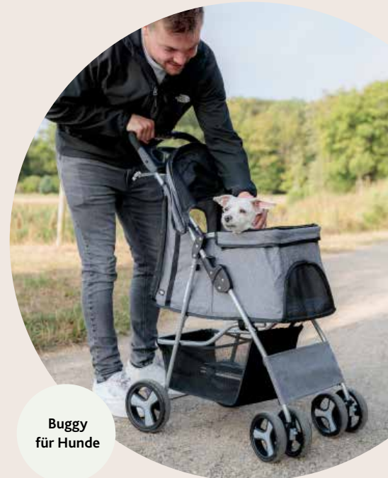
Buggy für Hunde

Für Katzenopis und -omis ist es jetzt wichtig, dass die Katzentoylette schnell und einfach zu erreichen ist. Zusätzliche Toiletten verkürzen die Wege.