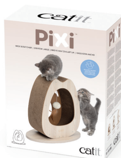
Art.-Nr. 42513 PIXI® Breite Kratzskulptur UPC 0-22517-42513-8 MASTER 4