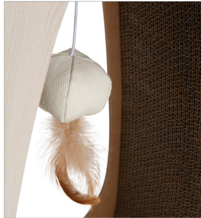
Ausgestattet mit einem unterhaltsamen Ballspielzeug mit Feder