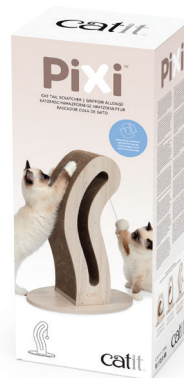
Art.-Nr. 42515 PIXI® Katzenschwanzförmige Kratzskulptur UPC 0-22517-42515-2 MASTER 4