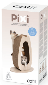
Art.-Nr. 42511 PIXI® Hohe Kratzskulptur UPC 0-22517-42511-4 MASTER 4

Die Verkleidung der Außenseiten in Eichenholz-Optik verleiht den Catit PIXI® Kratzskulpturen ein wunderschönes, edles Aussehen. Die Kratzskulpturen sehen nicht nur toll aus, sondern lenken die Krallen deiner Katze auch von deinen Möbeln weg auf die Kratzfläche aus Pappe.